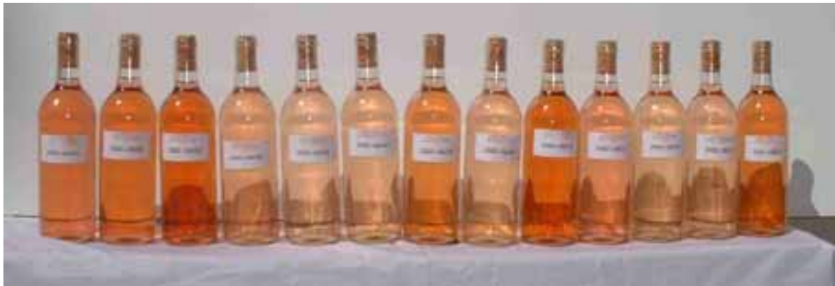
Figure 2. Aperçu de la variabilité de couleur obtenue après minivinification de 13 parcelles de Grenache de l'Observatoire Grenache-Cinsaut en 2000.

La forte variabilité d'expression du cépage Grenache a également été observée sur la couleur des vins rosés (Masson, 2003). La photo de la figure 2 illustre ces variations. Les travaux statistiques présentés plus haut permettent de proposer une première interprétation à ces différences de couleur et feront l'objet d'une future communication.