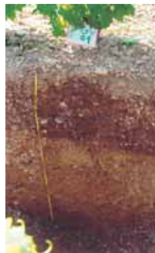
Photo 1. Exemple d'une fosse pédologique sur un des terroirs provençaux de l'Observatoire Grenache-Cinsaut

Sur chacune des 14 parcelles de Grenache une fosse pédologique est réalisée et interprétée par un bureau d'études spécialisé (photo 1). Les nombreuses informations recueillies à cette occasion (indices racinaires, réserve utile, analyses de terre, texture...) sont fortement variables d'un site à l'autre. Ces résultats illustrent la grande hétérogénéité des sols viticoles provençaux et confirment que les parcelles retenues pour notre étude couvrent bien la diversité pédologique naturelle du vignoble. Une analyse statistique complète de ces observations est en cours