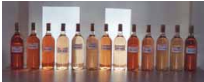
Photo 2. Aperçu de la variabilité de couleur de 13 vins rosés de Grenache obtenus à partir des principaux terroirs provençaux.

Les résultats sont en cours d'interprétation et doivent être maniés avec précaution. Les paramètres sujets aux plus fortes variations semblent être la couleur et l'acidité des vins. Les valeurs d'intensité colorante varie d'un facteur 1 à 4 (photo 2) alors que le rapport acide tartrique/acide malique peut aller du simple au quintuple.