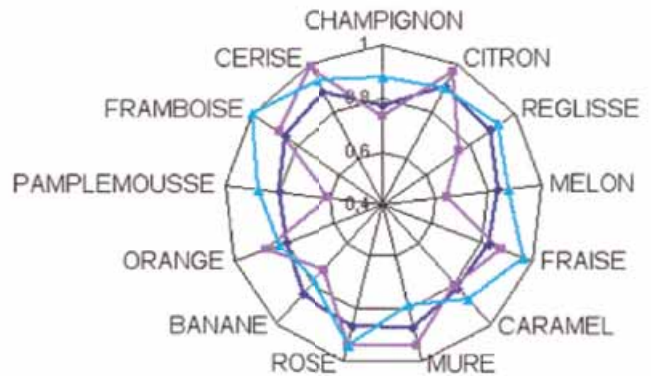
Graphique 1 : résultats d'entraînement olfactif dans l'eau - exemple de 2 juges et du groupe d'analyse sensorielle.

Le graphique 1 présente des résultats d'entraînement olfactif dans l'eau de 2 sujets et du groupe pour les 13 odeurs générées au préalable. Nous utilisons dans cet exemple un test statistique de classement. Les descripteurs d'odeurs bien quantifiés ont un coefficient proche de 1. Nous pouvons observer, dans ce cas de figure, que le juge 1 est plus performant que le sujet 2. Selon les odeurs, les résultats individuels seront différents. Le groupe classe relativement bien les intensités des odeurs dans l'eau puisque le coefficient statistique oscille entre 0,8 et 1. Cet exercice est plus délicat dans le vin comme en atteste les résultats du dégustateur 1 dont les performances sont pourtant excellentes dans l'eau (graphique 2). Il rencontre des difficultés à quantifier les odeurs de citron, rose et framboise dans le vin. Cette remarque est généralisable à l'ensemble des dégustateurs. Des entraînements supplémentaires s'imposent dans le vin pour le groupe.